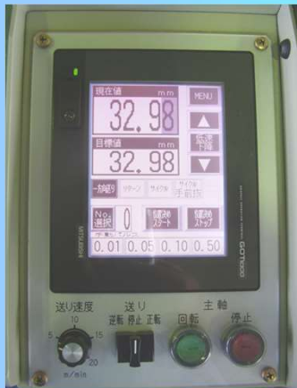
操作パネルデジタル表示1/100