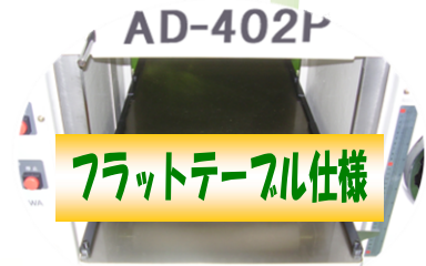
フラットテーブル仕様