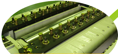
チップブレーカー前後